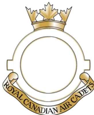
Figure 7: Modèle d'insigne d'escadron