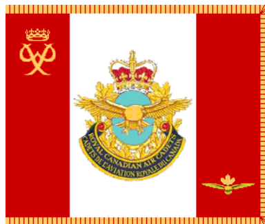
Illustration 4: Bannière des cadets de l'aviation royale du Canada

La bannière des cadets de l'aviation royale du Canada a été approuvée par le Gouverneur général du Canada en octobre 1990. Elle est basée sur le drapeau canadien avec, au centre, l'insigne bilingue des cadets de l'aviation royale du Canada. Le chiffre du prince Philippe figure dans le guindant supérieur et le symbole de l'étendard des cadets de l'aviation royale du Canada dans le battant inférieur.