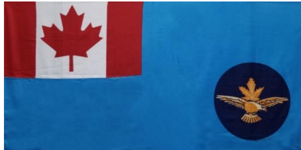
Illustration 1: Enseigne des cadets de l'Air

surmonté d'une feuille d'érable, en or, dans un cercle bleu royal. L'étendard des cadets de l'air est plus ancien que la bannière de l'escadron des cadets de l'air. Les étendards sont disponibles au bureau national de la ligue des cadets de l'Air du Canada.