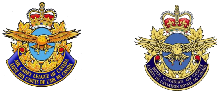
Illustration 5: Insignes officiels

Les insignes officiels des cadets de l'Air et de la ligue des cadets de l'Air du Canada ont été approuvés pour être utilisés par les escadrons et les comités sur les documents officiels, les en-têtes de lettres, etc. L'insigne représente un faucon en vol sur fond d'une couronne de feuilles d'érable. Des rubans portant les mots " Royal Canadian Air Cadets - Cadets de l'aviation Royale du Canada " et " The Air Cadet League of Canada - La Ligue des Cadets de l'Air du Canada " traversent la base de l'insigne. Les insignes sont illustrés ci-dessous.