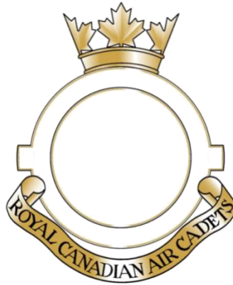
Figure 7: Modèle d'insigne d'escadron