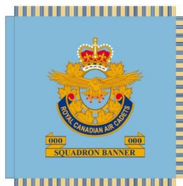
Illustration 2: Bannière des cadets de l'Air

La bannière de l'escadron des cadets de l'air a été approuvée par la Ligue des cadets de l'air du Canada en 1963 pour être remise aux escadrons des cadets de l'air. Le dessin officiel de la bannière consiste en un champ bleu de la Force aérienne sur les deux côtés duquel est brodé l'insigne officiel des Cadets de l'Aviation royale du Canada. Sous l'insigne, un parchemin brodé comprend le nom et le numéro de l'escadron. La bannière de l'escadron des cadets de l'air est junior à l'enseigne des cadets de l'air et n'est portée que par les membres de l'escadron auquel elle est présentée. On peut se procurer des bannières brodées au bureau national de la Ligue des cadets de l'Air du Canada. Afin de réduire les coûts, les escadrons sont autorisés à obtenir et à utiliser une bannière non brodée. Une directive spéciale décrivant les cérémonies de présentation et les mouvements d'exercice pour la présentation des enseignes et des bannières des cadets de l'Air est disponible au bureau national de la Ligue des cadets de l'Air.