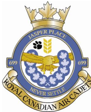
Illustration 6: Exemple d'insigne d'escadron

Afin de fournir une base officielle pour les insignes individuels d'escadron, la Ligue des cadets de l'Air du Canada a adopté un modèle de base pour un tel insigne et a établi une procédure en vertu de laquelle l'approbation officielle requise peut être accordée. Un exemple d'insigne est illustré ci-dessous.