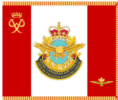
Illustration 4: Bannière des cadets de l'aviation royale du Canada

La bannière des cadets de l'aviation royale du Canada a été approuvée par le Gouverneur général du Canada en octobre 1990. Elle est basée sur le drapeau canadien avec, au centre, l'insigne bilingue des cadets de l'aviation royale du Canada. Le chiffre du prince Philippe figure dans le guindant supérieur et le symbole de l'étendard des cadets de l'aviation royale du Canada dans le battant inférieur.