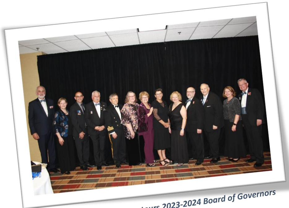
DG & Conseil des directeurs 2023-2024 Board of Governors